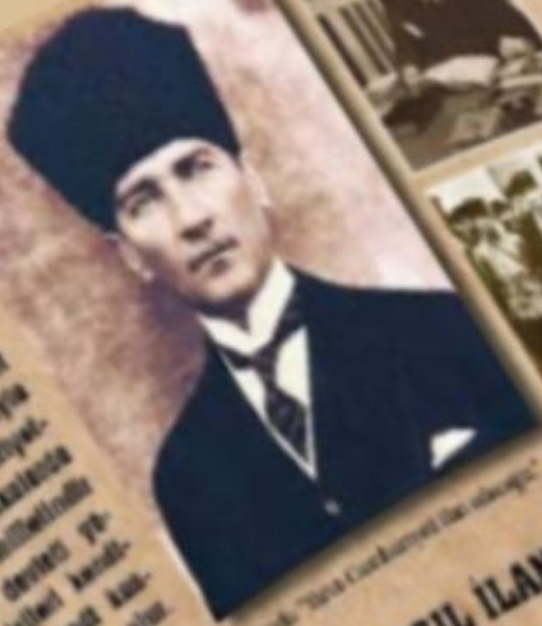
Atatürk "Türk Cumhuriyeti ile beraber"