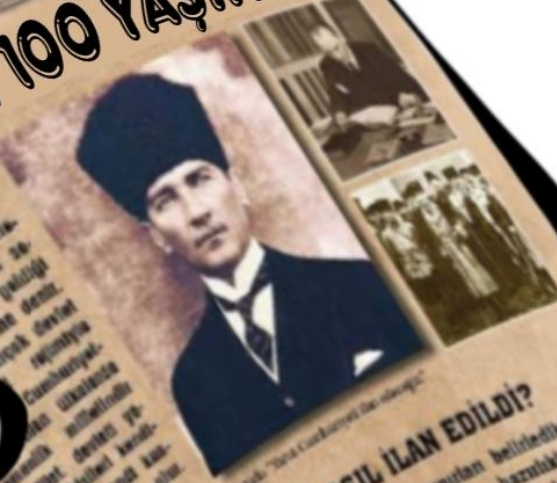
Atatürk "Yeni Cumhuriyetin Kurucusu"

Cumhuriyet, devle- ti idarek idare edilen se- çimle bir hükümet şekli- yatından başka devlet şekliyle bir devlet Cumhuriyet. devlet idaresinde ve millet devletin fa- aliyetinde bir devlet ka- nunuyla kurulmuş bir devlettir.